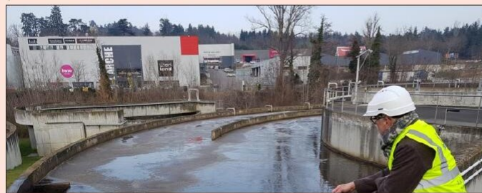
Les neuf communes concernées par le nouveau contrat sont celles qui sont raccordées à la station d'épuration de Furania.

Au contraire de la délégation de service public (service géré par une entreprise privée) pour l'eau, les élus de Saint-Étienne Métropole ont validé le choix de la régie publique (service géré par les collectivités) pour l'assainissement collectif et non collectif ainsi que pour la gestion des eaux pluviales urbaines. Un appel d'offres a là aussi été lancé, et c'est cette fois-ci la Stéphanoise des eaux (en groupement avec FMI Process), la mieux-offrante, qui a remporté le contrat. Un contrat de 63 millions d'euros sur six ans et neuf mois. À Saint-Étienne, c'est là aussi la fin d'une DSP qui datait de 1992 (et qui était entre les mains de la Saur).