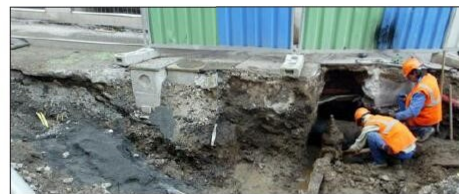
Les réseaux de canalisations représentent 1 112 kilomètres de linéaire.

Parmi les autres critères de choix de Saint-Étienne Métropole pour le délégataire de service public, il y avait aussi notamment l'entretien et le renouvellement des réseaux de canalisations (qui représentent 1 112 kilomètres de linéaire), ainsi que l'amélioration du rendement de ces réseaux (1), qui doit passer de 80 à 87 %, ainsi que de la station de traitement de Solaure (objectif de rendement de 96 %) (2). Ces améliorations de rendement devraient, selon les estimations, permettre de prélever 11 millions de m 3 d'eau en moins sur la durée de la délégation. « Sur tout le mandat, soit jusqu'en 2026, nous avons prévu de consacrer chaque année 3 à 5 millions d'euros pour des travaux », souligne